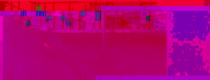
图 1 LSF型螺旋旋砂水分离器